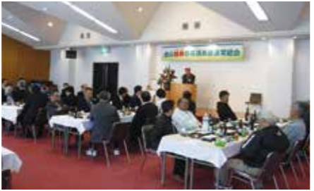
第41回総会に出席された皆さん