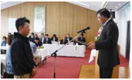
出荷共励会の表彰

令和元年度は、キュウリ・ニラ・ミニトマト・ネギ・ネギ(葉ネギ)・シシトウ・アスパラガスの品目で合計数量477、450結、販売金額2億3917万円を計画しています。