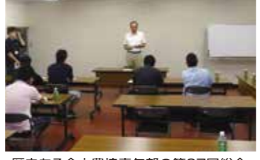
歴史ある金山農協青年部の第67回総会