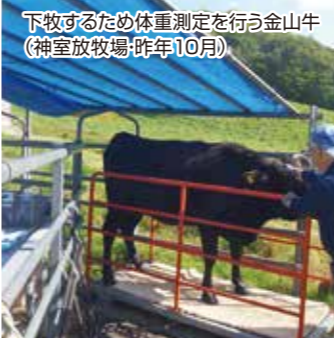
下牧するため体重測定を行う金山牛（神室放牧場・昨年10月）

格付けでは4等級以上が100%、5等級以上が約7割ありました。枝肉重量では去勢14頭が平均500kg、雌10頭の平均で473kgとなり増体として