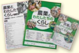
J Aバンク食農教育応援事業の一環として町内の小学校に贈られた「農業とわたしたちのくらし」

J A金山は4月上旬、小学生に食と環境・農業への理解を深めてもらうと、高学年向け補助教材「農業とわたしたちのくらし」を町内小学校へ贈りました。J Aバンクが平成20年度から展開しているJ Aバンク食農教育応援事業の一環で、今回の2019年度版は新学習指導要領に対応し、「主体的・対話的で深い学び」の趣旨を踏まえ、教材本の全面改訂とDVDの部分改訂を実施。主に社会科の第5学年の学習内容との関連をはかり構成され、家庭科や総合的な学習でも活用できる内容となっています。