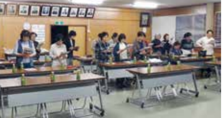
参加された部員の皆さん