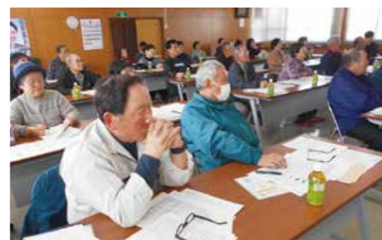
高品質ニラの拡大にむけ熱心に説明を聞く生産者の皆さん。約40人が参加。

「金山活粋野菜倶楽部」は新年度早々4月3日、「ニラ栽培講習会」をJ A金山会議室で開催、ニラの栽培管理や販売方針、一層の高品質ニラ継続出荷に向けた取り組みを確認しています。 平成30年度は、最上広域での販売戦略が功を奏し、出荷量は前年並みであったもののシーズンを通して高値で取引され、単価は前年比12・4%高の1キ当たり618円、販売金額が7・1%増の2億667万円となりました。 令和元年度では、市場の要望にこたえられる出荷量の確保やブランド規格の統一、「エナジーグリーンベルト」の面積拡大などに取り組みを確認。出荷形態は鮮度保持袋のFG(フレッシュユアンドグリーン)を使用し100g入りと同90g入り、最上広域の取り組みとして加工8キとしています。